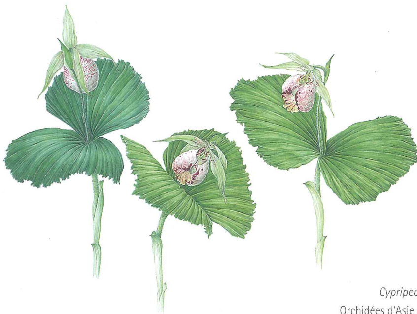
Cypripedium japonicum : Orchidées d'Asie de l'Est présente au Japon, en Corée et en Chine.

des Peignes-de-Vénus 17 . Il joue alors plus fort de sa flûte, aussitôt Écho lui répond. Cypripédien maintenant cabriole, soufflant lèvres posées aux roseaux collés de cire.