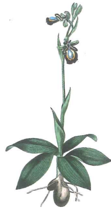
Ophrys speculum Link. (24)

À peine arrivé au sommet de la colline, le troupeau part en dévalant la pente à la recherche de l'ombre garantie par le bosquet. Cyripédien lui n'accélère point le pas, mais fouille du regard l'endroit, afin de trouver la meilleur place pour manger et surtout pouvoir faire sa sieste digestive sacrée. Arrivé près de la rivière, il pose un genou à terre et étanche sa soif, en amont de son troupeau, qui broute paisiblement les rares Poils-de-chèvre 7 et Poil-de-cochon ou Queue-de-renard 8 qui poussent dans le sous-bois clair près de la rivière. Il sort son casse-croute du sac et déjeune, tout en gardant un œil sur ses brebis. Repu, il se met à la recherche du meilleur endroit pour son somme. Il aime le faire au frais et surtout sans être dérangé. Une fois trouvé l'emplacement rêvé, sous un couple de Chêne chevelu 9 et pubescent 10 , il s'installe confortablement sur un lit de Capillaire 11 et s'endort.