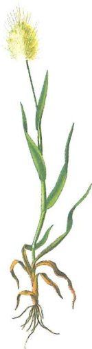
Lagurus ovatus L. (12)