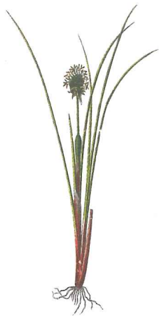
Eriophorum vaginatum L. (25)